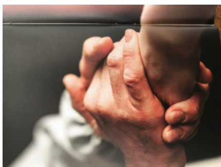
Service Évangélique des Malades

Nous sommes peu nombreux et malgré nos prières, nous ne rajeunissons pas. Alors venez nous rejoindre sur ce beau chemin. Il y a des hommes et femmes qui vous attendent.