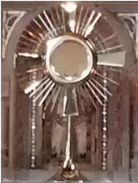
Adoration à Notre-Dame- du-Perpétuel-Secours

Tantum ergo Sacramentum Veneremur cernui: Et antiquum documentum Novo cedat ritui: Praestet fides supplementum Sensuum defectui. Genitori, Genitoque