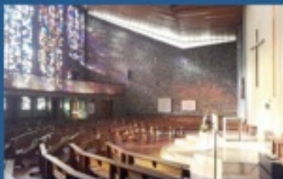
Chapelle St Daniel