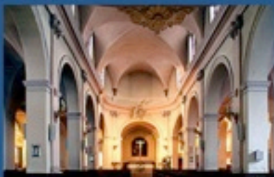
Eglise Ste Geneviève

LE DIMANCHE 10 SEPTEMBRE 11 HEURES NOTRE DAME DU PERPETUEL SECOURS